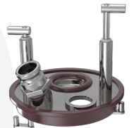
TAMPAS DE CAPTAÇÃO DE VAPOR