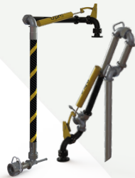
BRAÇOS DE CARREGAMENTO